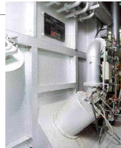
焼却炉 焼却炉でごみを完全燃焼します。