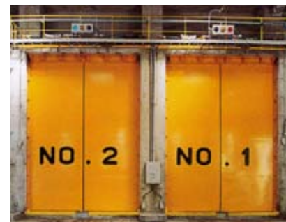
プラットフォーム 収集車が搬入したごみは、ここからごみピットへ投入されます。