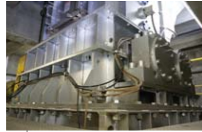
破袋機 収集袋を破き、給じん機へ送ります。