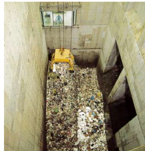
ごみピット・ごみクレーン ごみピットにためられたごみをごみクレーンで攪拌した後、ごみ投入ホッパへ投入します。