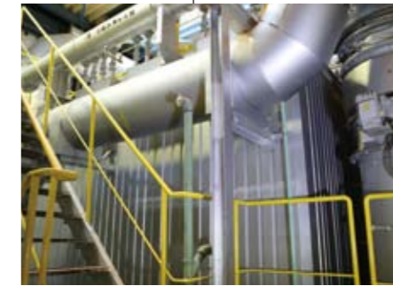
ろ過式集じん器 排ガス中のばいじんは、バグフィルタによって微細なばいじんまで完全に取り除かれます。