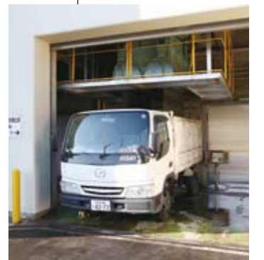
灰バンカ 灰バンカにたくわえられた薬剤処理後の飛灰は、この灰バンカより搬出車に積込まれて最終処分場へ運ばれます。