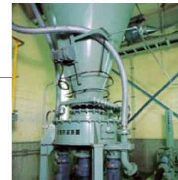
有害ガス除去装置 プラスチック等の燃焼によって発生する有害ガスは薬品と反応して無害化されます。