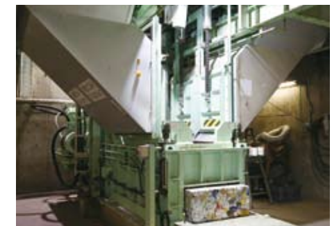
金属プレス機 選別回収された鉄分とアルミ分は、金属プレス機により圧縮成型されます。