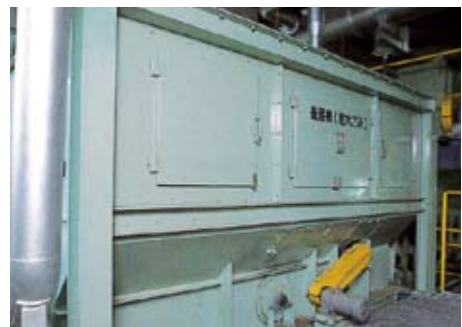
磁選機 ごみの中の鉄分を磁選機で回収します。