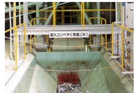
資源ごみ受入コンベヤ 収集車から搬入した資源ごみは、専用の受入ホッパへ投入されます。