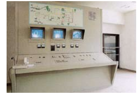
粗大ごみ操作室 本施設の運転は、集中的に監視制御されます。