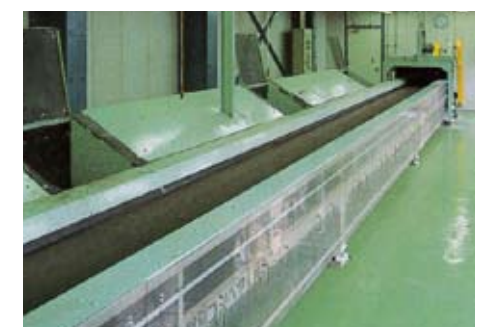
手選別コンベヤ 資源ごみよりガラス、その他を選別します。