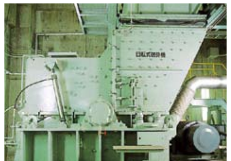
回転式破砕機 粗大ごみは回転式破砕機で破砕されます。