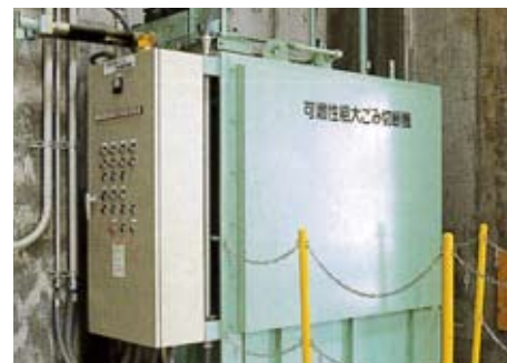
可燃性粗大ごみ切断機 可燃性粗大ごみは破砕されて、ごみピットへ投入されます。