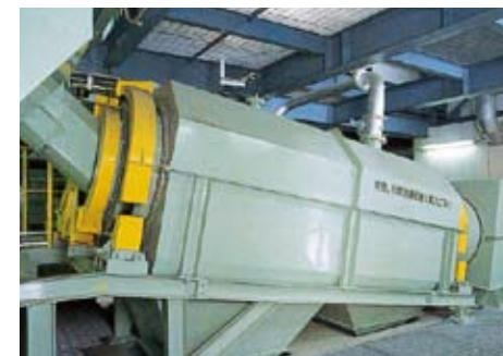
可燃物・不燃物選別機 鉄分を回収したごみは、可燃物と不燃物に分離されます。