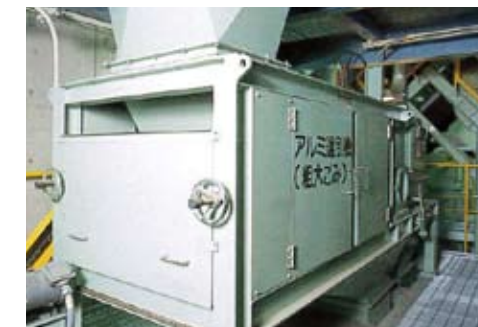
アルミ選別機 分離された資源ごみよりアルミを選別します。